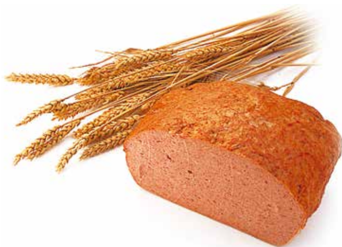
Pain de viande Augustin Augustijnerbrood Hackbraten Natur Augustin meat loaf