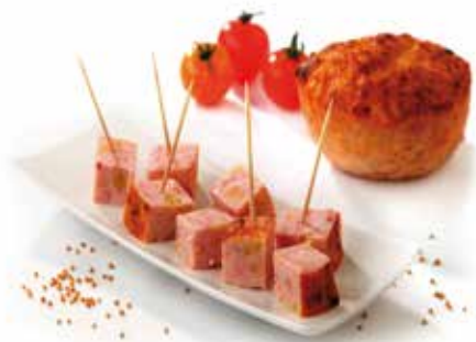
Mini Pain de viande moutarde Mini vleesbrood met mosterd Mini-Hackbraten mit Senf Mini meatloaf with musterd