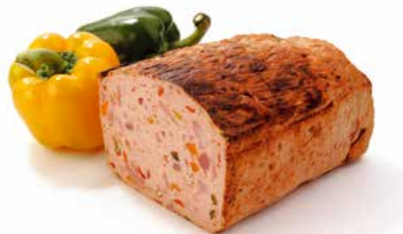
Pain de viande provençal Provençaals vleesbrood Hackbraten mit Paprika Meat loaf Provencale