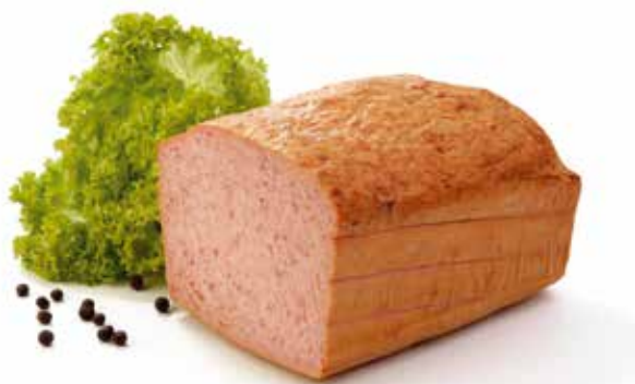
Pain de viande Augustin carré Augustijnerbrood vierkant Hackbraten Natur vierkant Augustin meat loaf square